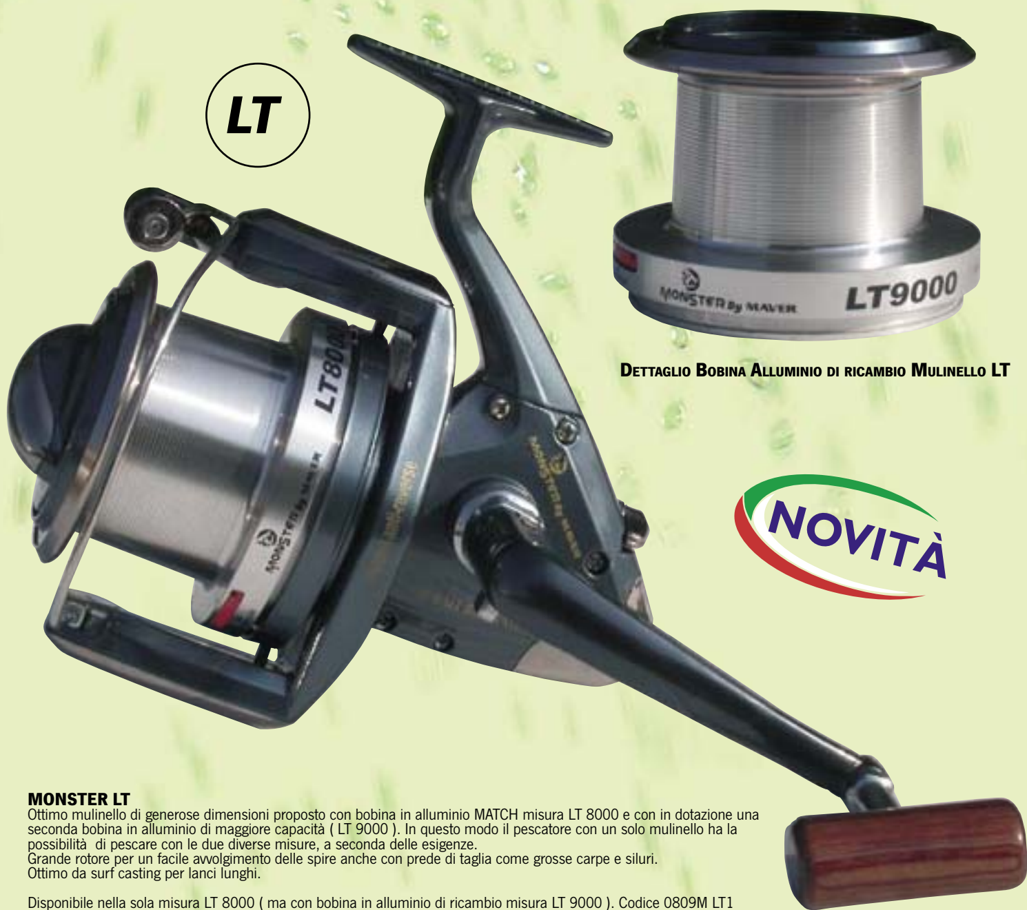
DETTAGLIO BOBINA ALLUMINIO DI RICAMBIO MULINELLO LT